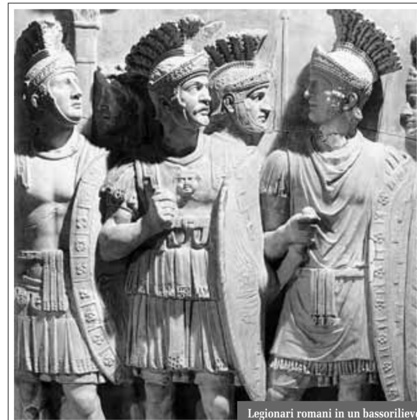
Legionari romani in un bassorilievo

loro. Con la Sicilia, nel 241 a. C., sorse i primi problemi. Meno difficile furono le cose con i popoli barbari d'Occidente. Ci fu una graduale, ma rapida integrazione perché questi barbari avevano un sentimento identitario assai labile, genericamente limitato a lingua e culti, mai tradotto in istituzioni; di fron-